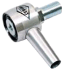
M18 x 2,5 отв.