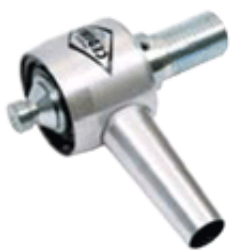
R 1/2" вал